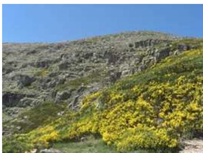
Cresta con el Circo de Gaudioso a la izquierda