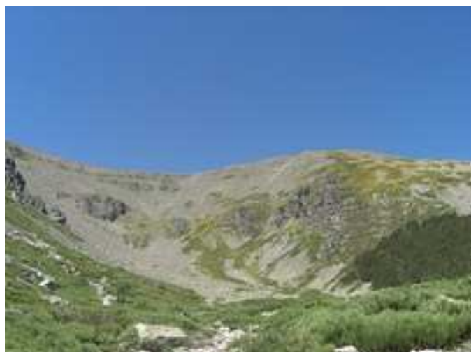
La Hoya de San Miguel y al fondo el Pico Moncayo