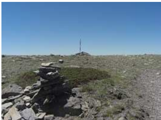
Montículo sobre el Collado de las Piedras