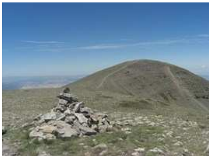
Vista de la subida al Pico Moncayo