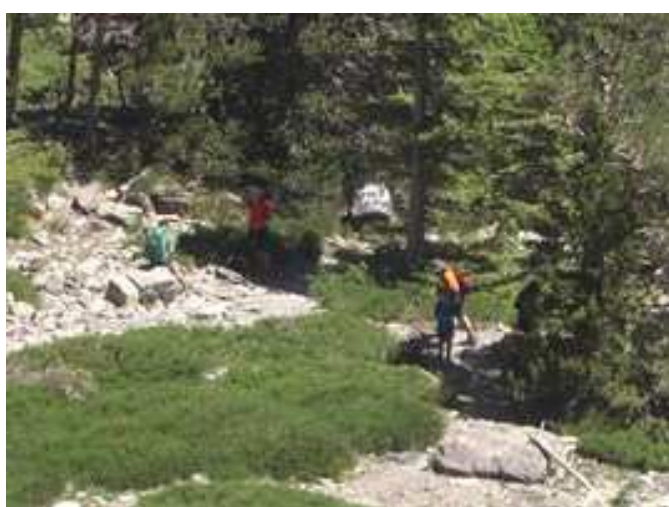
Inicio de la ascensión hacia el Collado de las Piedras