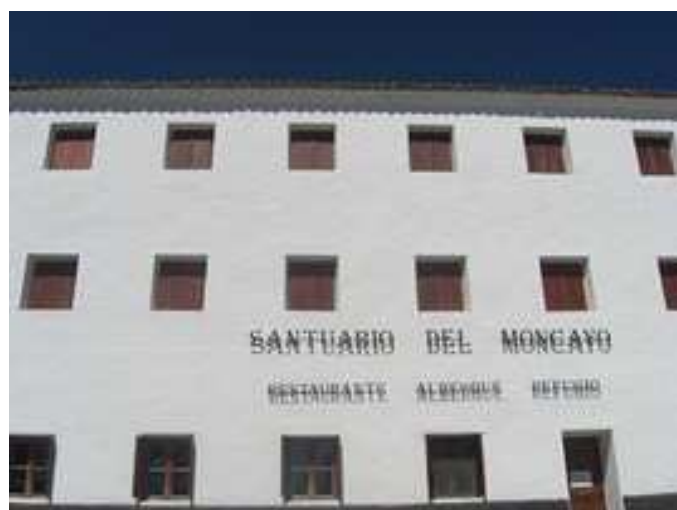
Albergue de Santa María del Moncayo