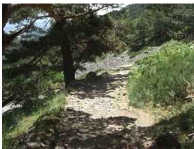
Inicio del sendero hacia la Hoya de San Miguel