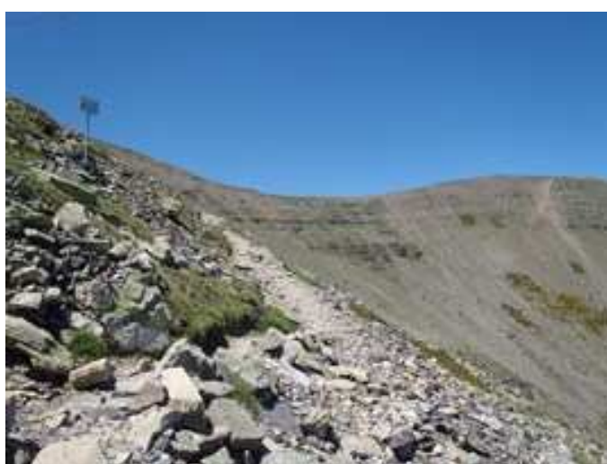
Subiendo por la loma con el Moncayo a nuestra derecha