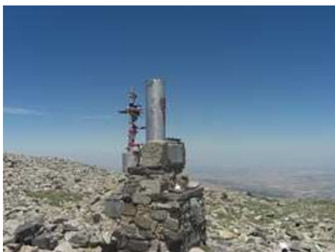
Imágenes de la antecumbre del Moncayo