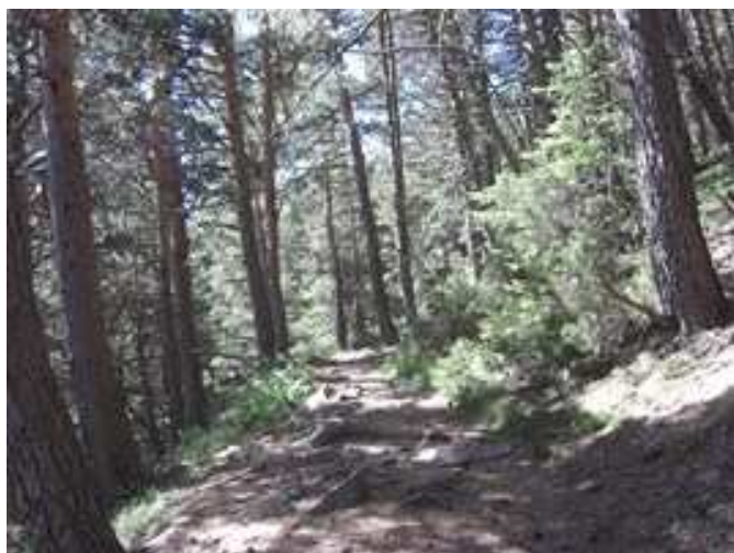
Ascendiendo por el bosque de pinos