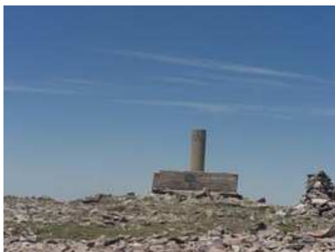
Vértice geodésico en la cumbre del Pico Moncayo