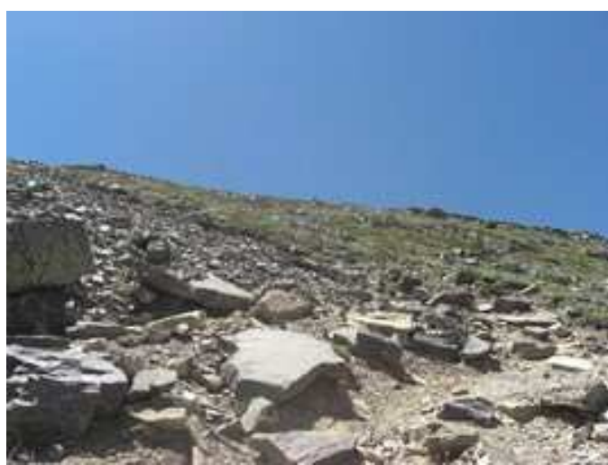
Últimas rampas antes de llegar al Collado de las Piedras