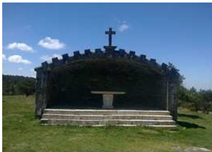
Ermita do faro