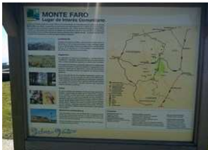
Cartel informativo en el Monte Faro