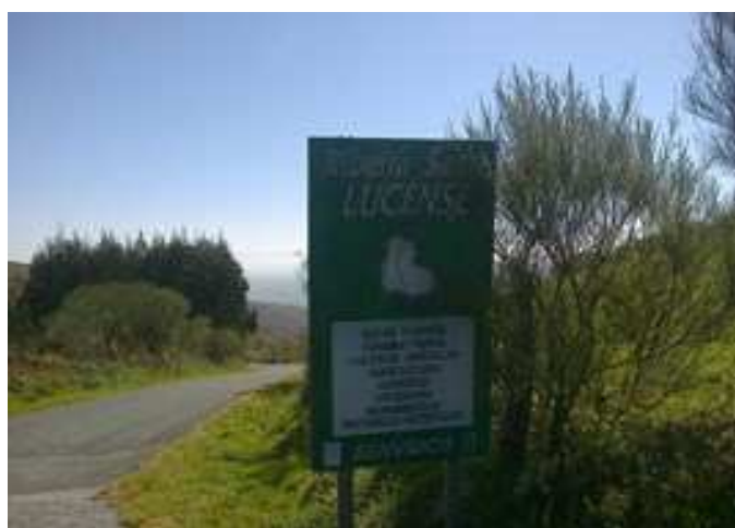
Cruce con la carretera as Matanza