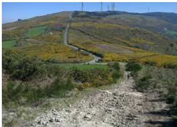
Descenso a la carretera de Matanza