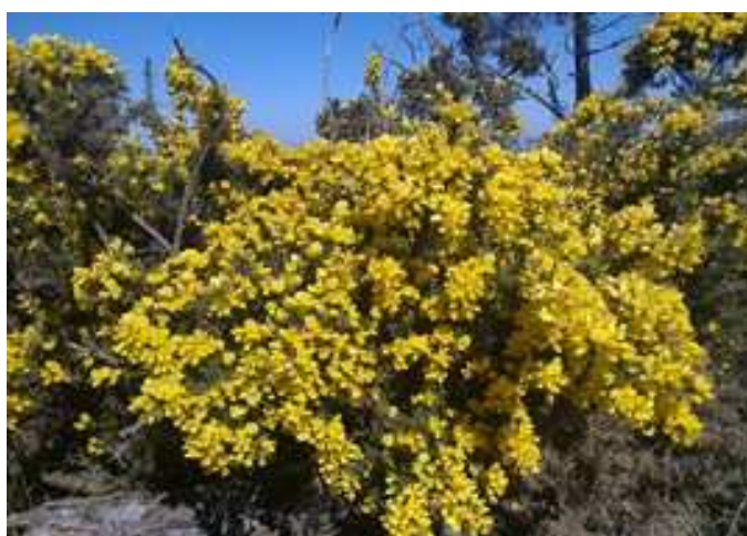
Planta del Toxo (Tojo), abundante en esta sierra