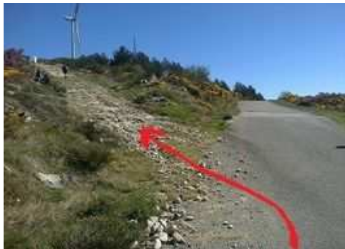
Desvío a tomar hacia el Monte Faro