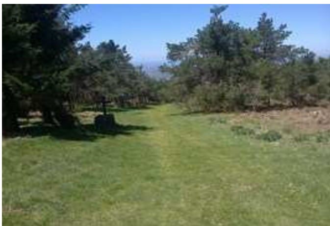
Cortafuegos de descenso desde la Ermita do Faro