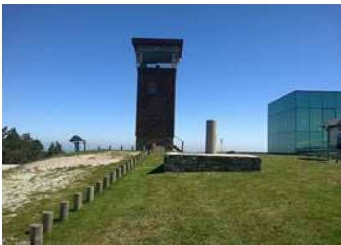
Cumbre del Monte Faro (1.187 m)