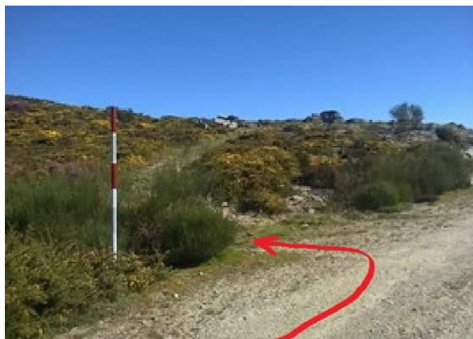
Desvío a tomar frente al mirador