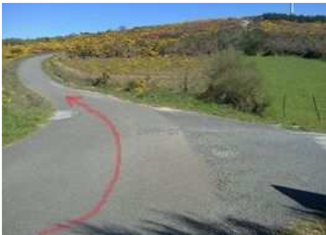
Desvío a tomar en la carretera