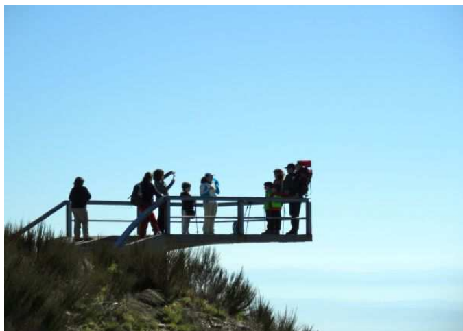
Mirador hacia la comarca de Chantada