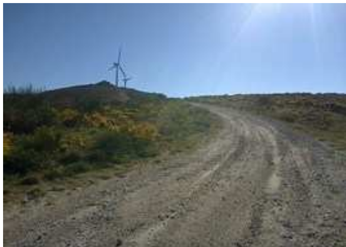
Pista hacia el Parque Eólico