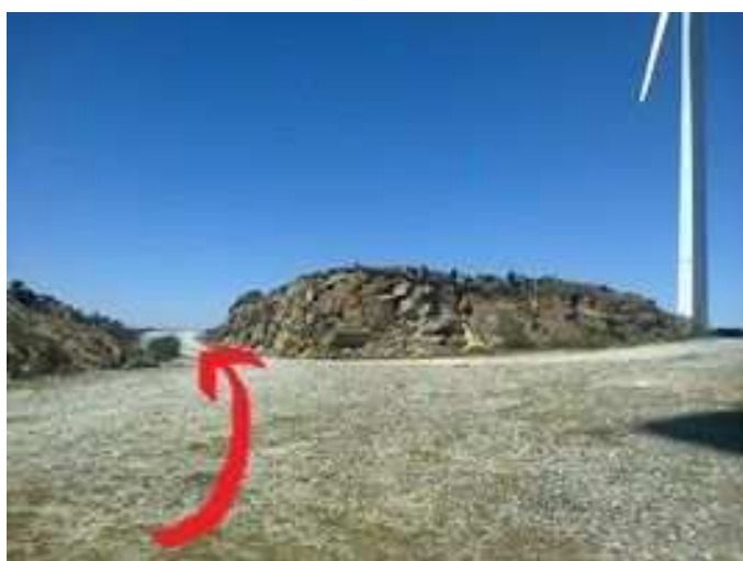
Desvío a tomar en Monte Loureiro