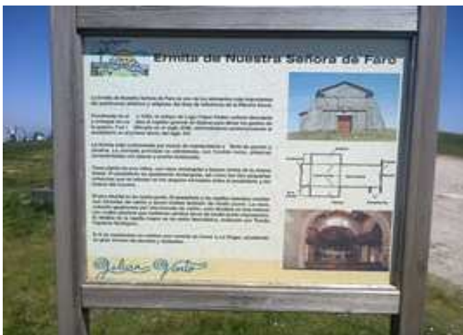
Cartel informativo de la Ermita de Faro