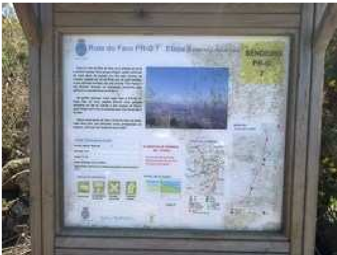
Panel informativo en al Puerto do Faro de la ruta PR-G-7