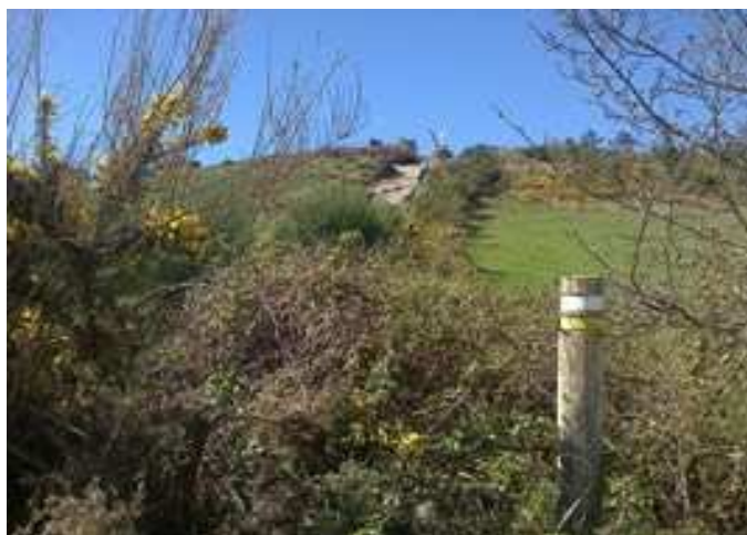
Señalización de la PR-G-7