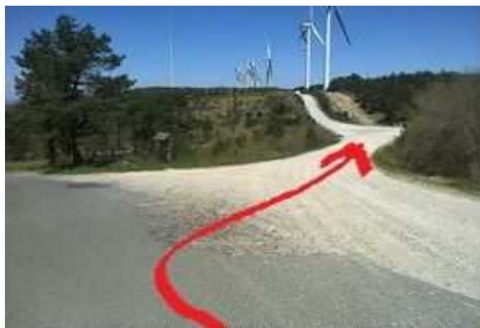
Desvío en la carretera a Ourín