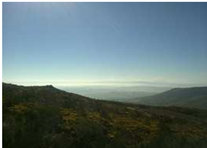
Vista hacia la Comarca de Chantada