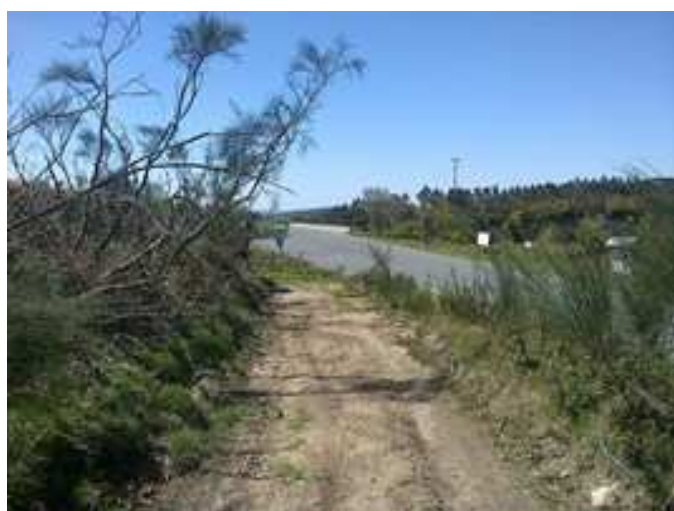
Llegada al Puerto do Faro. Fin de ruta