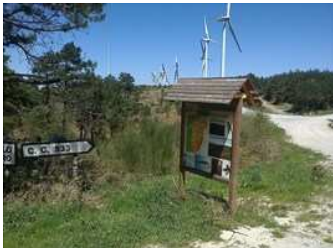
Panel en el desvío de la pista a seguir