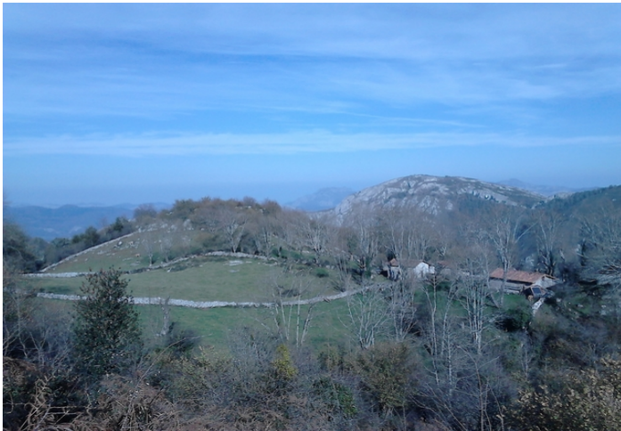
Vista de Las Llacerías cerca del collado