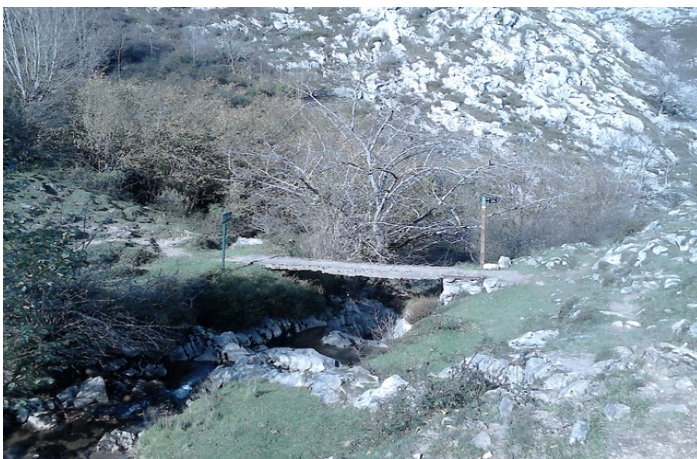
Puente de acceso a las cabañas de Las Mestas