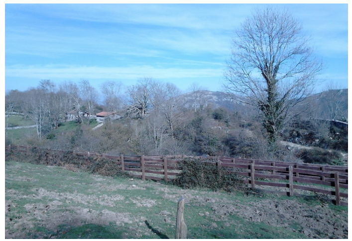
Entrada en las cabañas de Las Llacerías