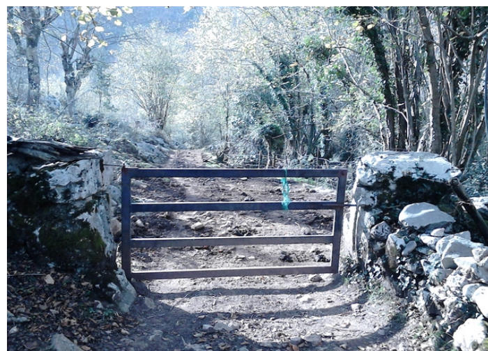
Lugar de Moferos. Inicio de la ruta Puerta de acceso cerca del inicio de la ruta