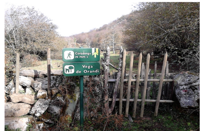
Verja de acceso a la Vega de Orandi