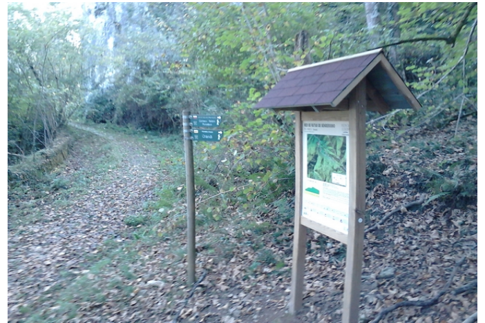
Descenso por el hayedo del Bosque del Monte Auseva Panel informativo de la ruta y final de la misma