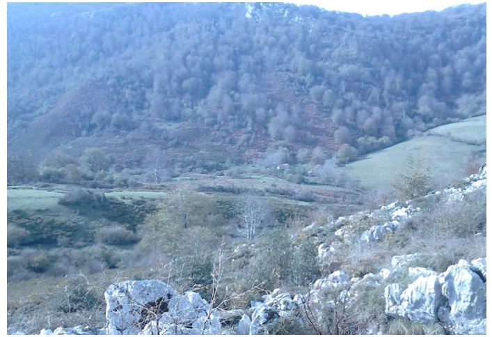
Vista de Las Mestas desde el collado