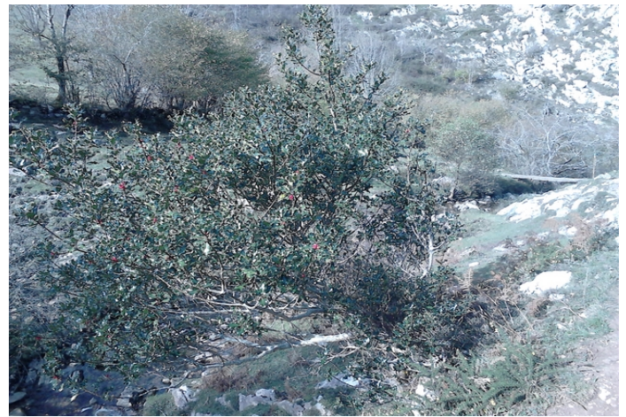
Río de las Mestas en las cabañas de mismo nombre