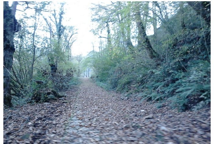
El sitio de Covadonga desde el final de la ruta Pista a la derecha para regresar al vehículo (Caso Circular)