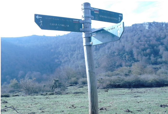
Confluencia de rutas en la vega de Las Mestas