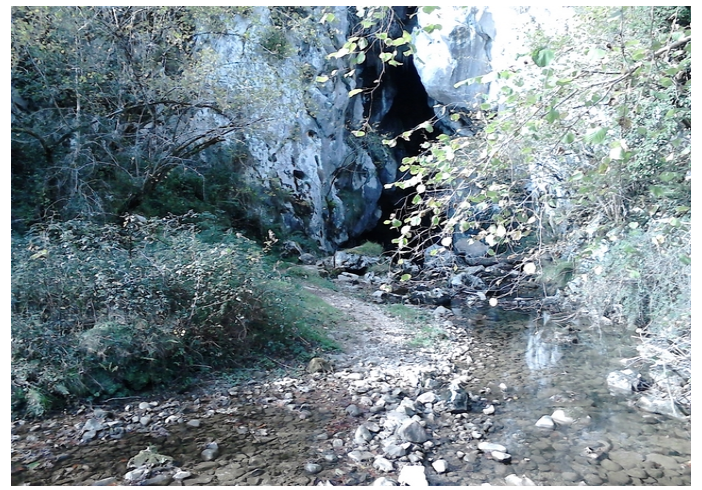
Entrada en la Vega de Orandi Cueva de Orandi donde entra el Río de Las Mestas