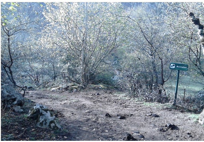
Paso por las cabañas del Bastañar