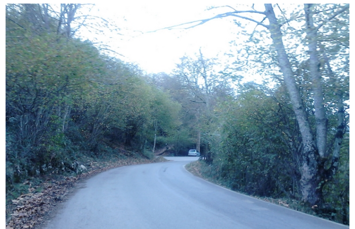
Carretera a Los Lagos (Caso Circular) Punto de inicio de la ruta (Caso Circular)